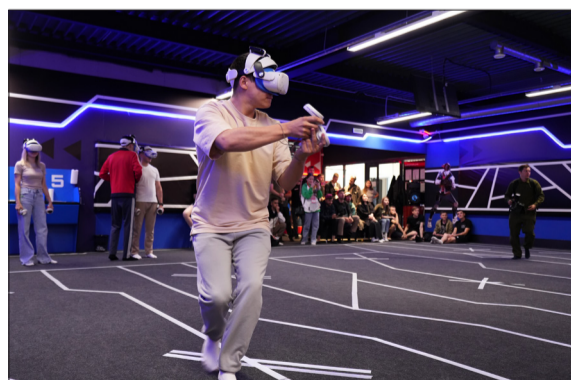
Впервые в рамках молодежной спартакиады прошел кибер-турнир на VR-арене

дам спорта и десятки различных игр. Подростки миксовали музыкальные сетсы под руководством диджея, взрослые наравне с детьми участвовали в мастер-классах и конкурсах. А самые маленькие шустро передвигались между площадками с домами-раскрас-