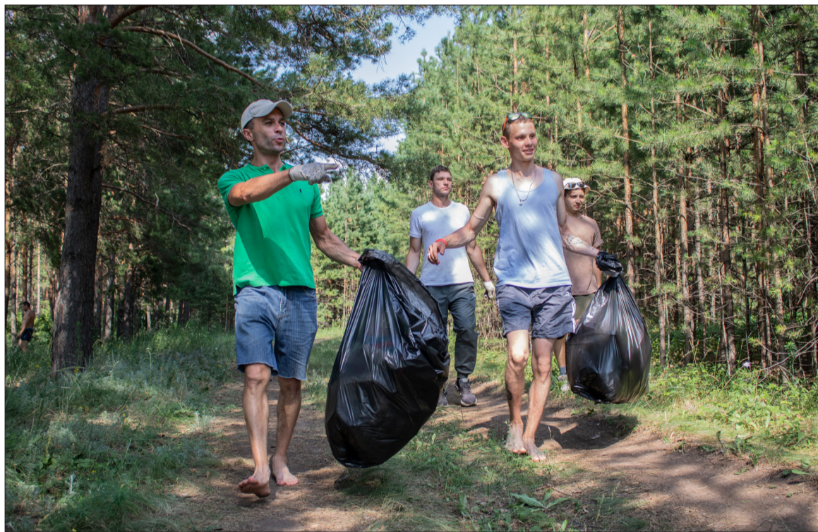
Инициативная команда нефтяников прошла вдоль берега озера и собрала весь пластиковый мусор

— Я приезжаю в Медведку каждый год с семьей. Здесь красиво и спокойно, поют птицы, в воздухе витает тонкий аромат сосны. Но, к сожалению, часто встречаются пакеты, бутылки и прочий перерабатываемый природой мусор. Мы никогда не остаемся в стороне и расчищаем берег. А в этом году доброе дело поддержали мои коллеги, и я с удовольствием к ним присоединилась, — отметила одна из участниц экосубботника Ма-