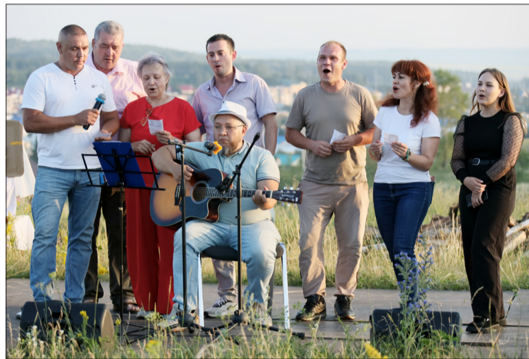
Цеховой ансамбль УК «Татспецтранспорт» исполняет песню «Конь» из репертуара группы «Любэ»

– Популярность бардовской песни, фестиваля «Вишневая гора» ежегодно растет. Появилось желание и возможность провести его в рамках межрегиональной профсоюзной организации Компании. Мы отвечаем на пожелания и поэтому в начале августа на Елабужской земле пройдет первый фестиваль бардовской песни Татнефть Профсоюза. Он будет совмещен с фе-